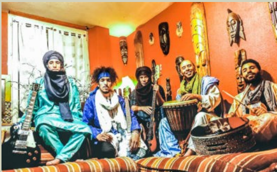
Le groupe Tigadrine, partenaire du projet

final, co-composer des textes qui seront mis en musique pour, in fine, être interprétés lors d'un concert que Tigadrine donnera au Brise Glace.